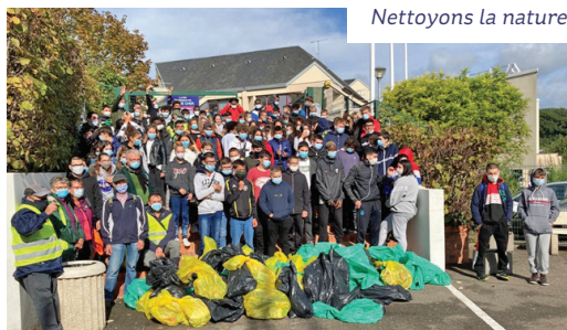
Nettoyons la nature

Voir l'ensemble des projets sur le site du lycée