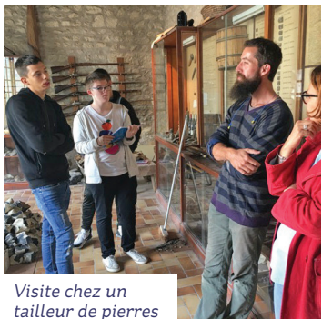
Visite chez un tailleur de pierres