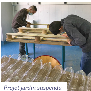
Projet jardin suspendu