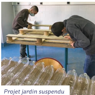
Projet jardin suspendu