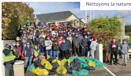
Nettoyons la nature

Voir l'ensemble des projets sur le site du lycée