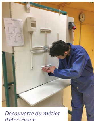
Découverte du métier d'électricien