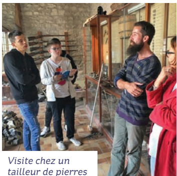
Visite chez un tailleur de pierres